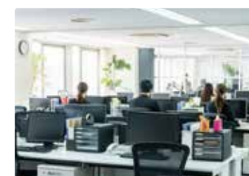
[ オフィス ]