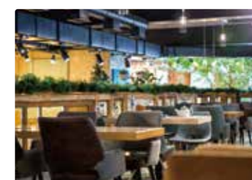
[ レストラン・カフェ ]