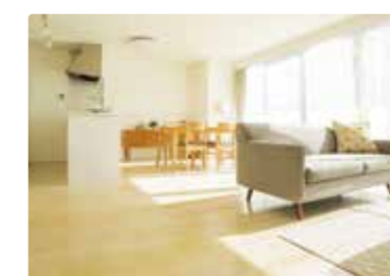
[ リビング ]