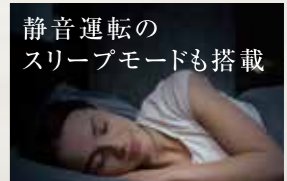
静音運転の スリープモードも搭載