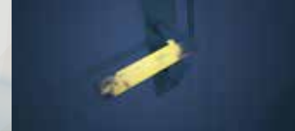
ドアノブに付着した菌・ウイルスを分解